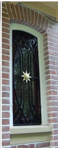
Rooster naast de voordeur, foto oude toestand, foto nieuwe toestand