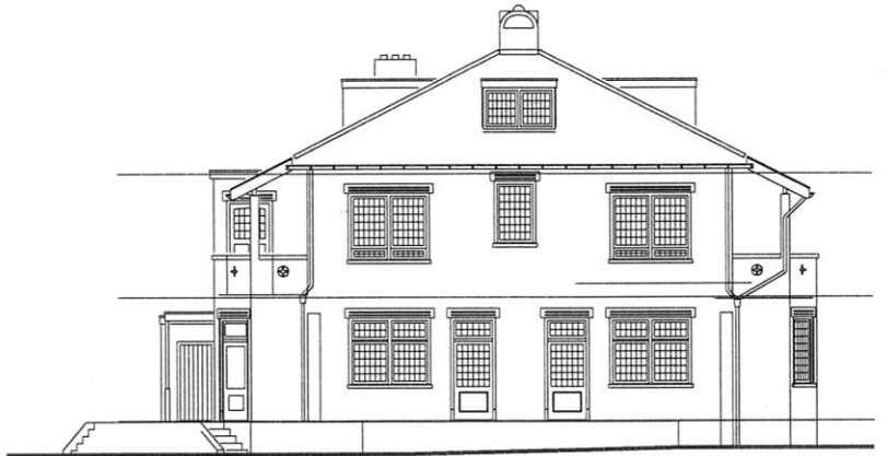
Gevels nieuwe toestand.